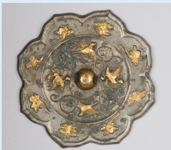
とう か そうほうそうちようはちりきょう 唐花双鳳双鳥八稜鏡 (神道博物館蔵)