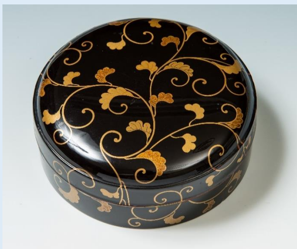
つたからくさもんまき かがみぼこ 蔦唐草文蒔絵鏡箱 (神道博物館蔵)

鏡を不思議に思う気持ちは、時代が移っても変わることはなく、今も息づいていると思います。鏡の持つ「うつす」という本質を実感していただければ幸いです。