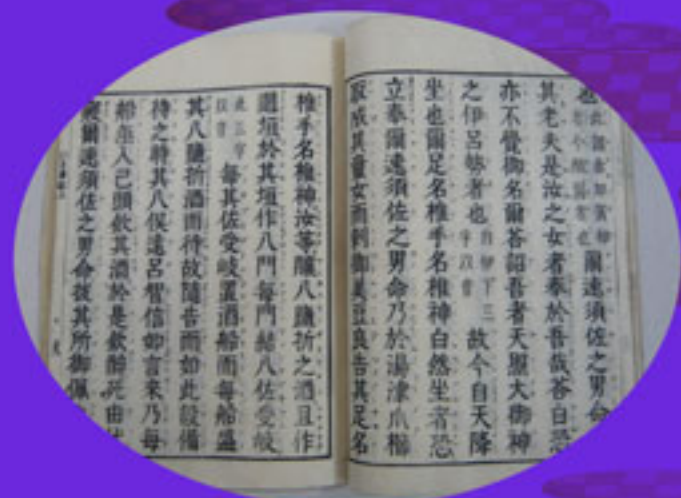
『古事記』上巻（皇學館大学附属図書館所蔵）