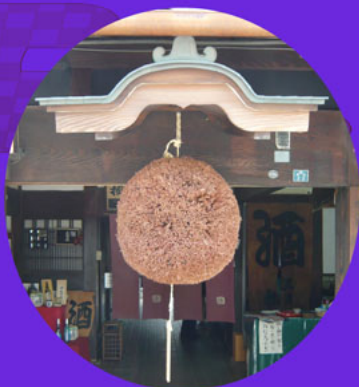
杉玉（今西酒造株式会社所蔵）

日本の伝統的な飲料である日本酒について、 その歴史や文化、そして神道との関わり方を 中心に、様々な観点からご紹介いたします。