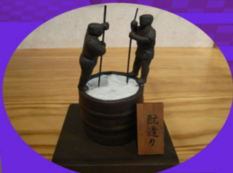
模型 麴造り（株式会社宮崎本店所蔵）