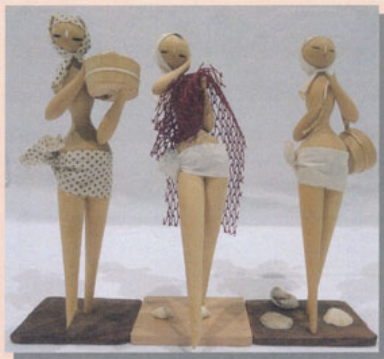
海女人形（ミキモト真珠博物館蔵）