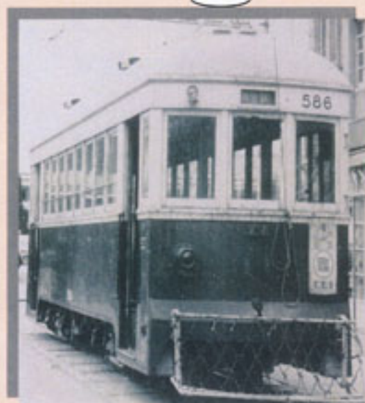
駅前を走る神都線（個人蔵）

本展示は「近代伊勢の観光」をテーマに、 「喰う」・「寝る」・「参る」の3つのキーワードを通して、 観光客側と迎える側の2つの視点から 「伊勢のお・も・て・な・し」を紹介します。