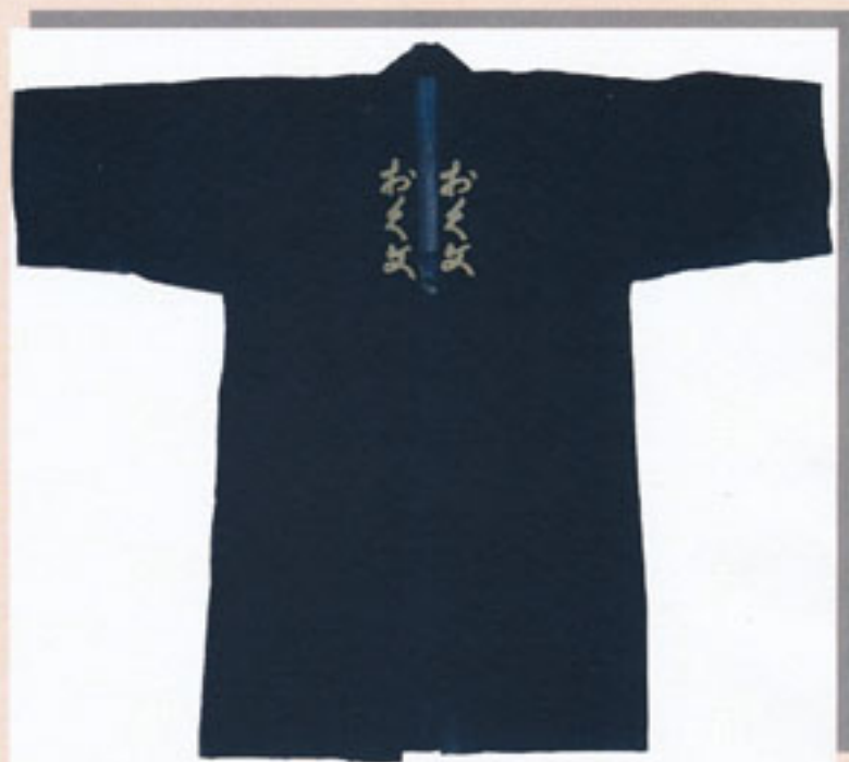
おく文旅館法被（個人蔵）