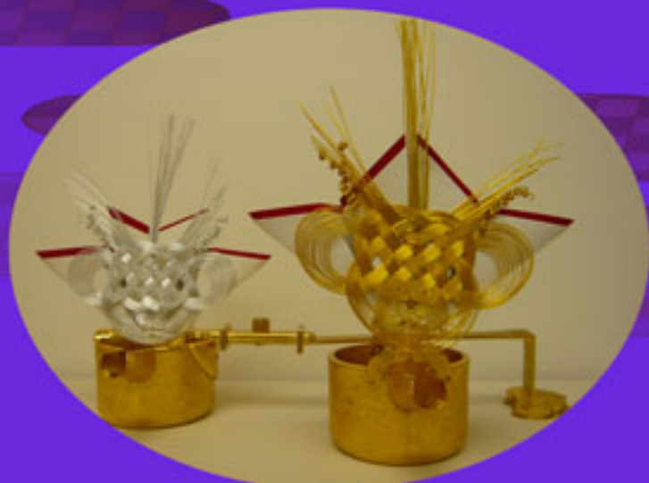
鉦子 雄蝶・雌蝶（皇學館大学神道学科所属）