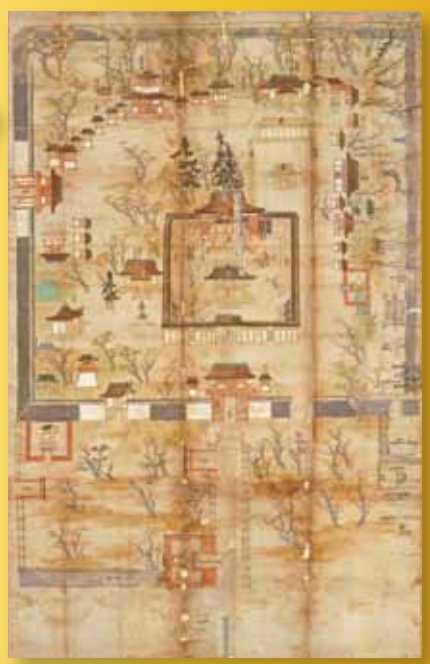
重文 祇園社絵図(八坂神社)