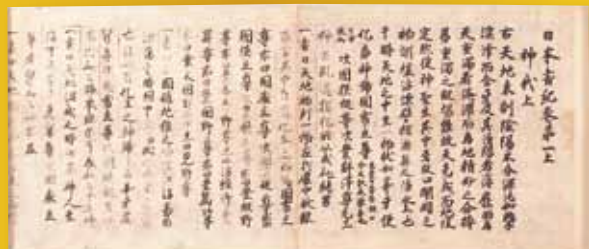
重文 日本書紀(熱田神宮)