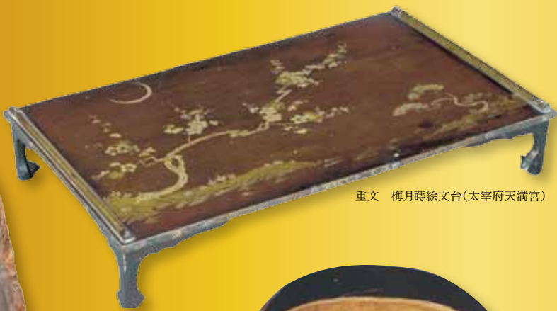
重文 梅月蒔絵文台(太宰府天満宮)