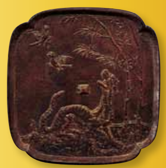
重文 竹虎双雀方鏡(春日大社)