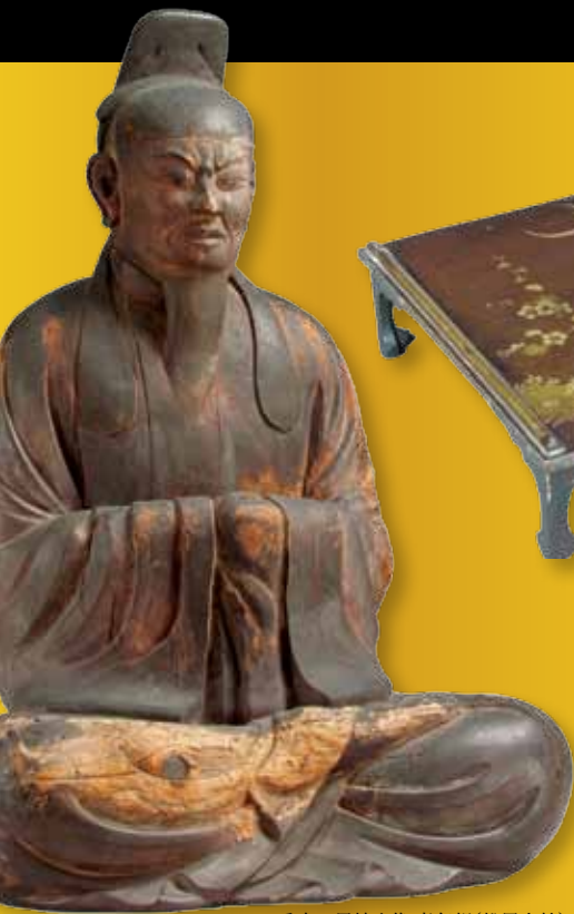
重文 男神坐像 老年相(松尾大社)

明治15年(1882)4月30日、神宮祭主久邇宮朝彦親王殿下の令達により林崎文庫に設けられた皇學館は、今年、創立130周年を迎えました。この間、官立の神宮皇學館から神宮皇學館大学となり、昭和21年(1946)3月には、連合国軍総司令部(GHQ)の命令により廃学。同37年(1962)4月からは私立大学として再興、本年は50周年の節目にあたります。この佳年に本学建学の精神をふまえ、我が国の歴史や伝統、文学と美術に関する名品や、神々に対する崇敬の様子を物語る絵画類を一堂に公開し、神社への信仰の様子と日本文化の精華の一端を感じていただければと存じます。