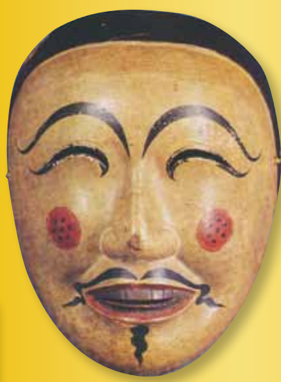
重文 舞楽面 新鳥蘇(春日大社)