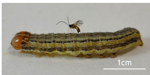
アワヨトウ幼虫に産卵するカリヤサムライコマユバチ成虫