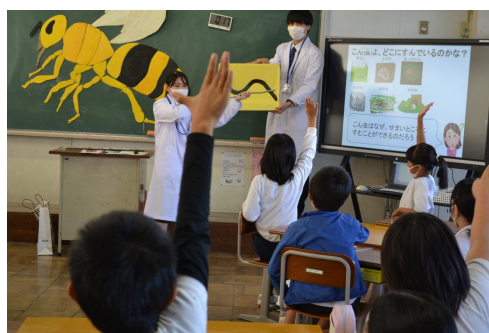
図2 出前授業の様子